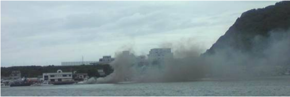
撮影は、白灯台より林会長