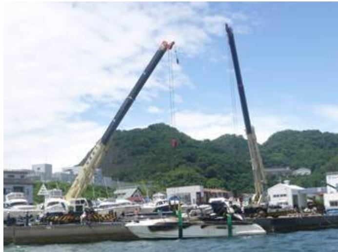
写真は、UR終了後撮影