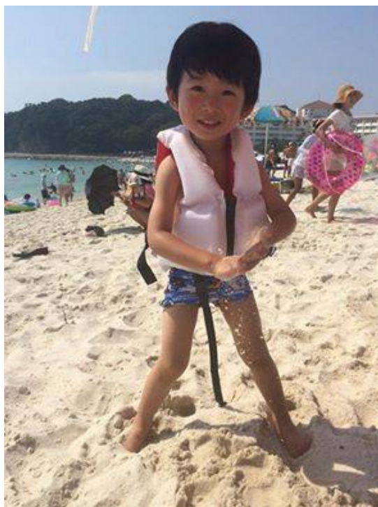
子どもたちにライフジャケットを！さんの写真