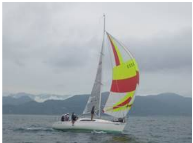
快走中の「めるあみ」