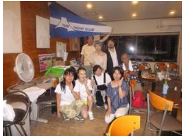
クラブハウスにて記念写真