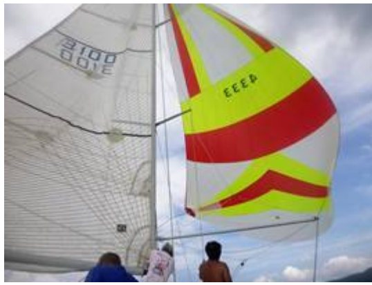
風が良ければスピラン