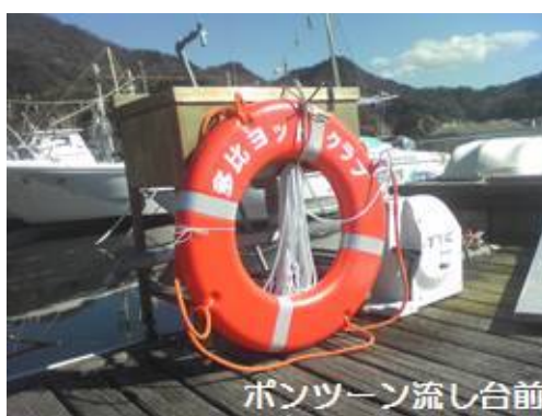
ポンツーン流し台前