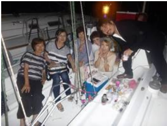
SUN LUCK と「しのさんとピアニスト」