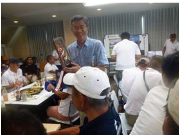
受賞した「めるあみ」