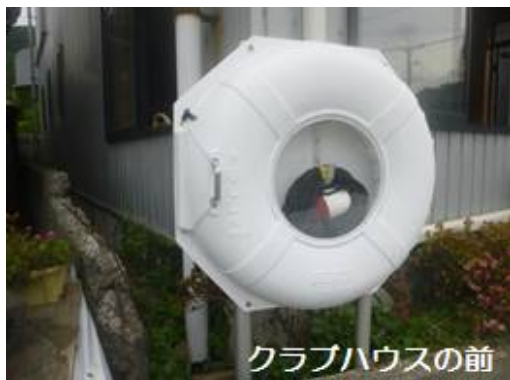
クラブハウスの前

最近、落水事故が多くなっております。クラブハウスを出る時から、ライフジャケットを着用する習慣を身に付けてください。あなたの命を守ることが出来ます。多比ヨットクラブは、救命浮き輪を2か所設置しました。（クラブハウス前とポンツーンの流し台前）是非、知って置いて下さい。落水者を発見した時などの緊急時は、どなたでも使用できます。