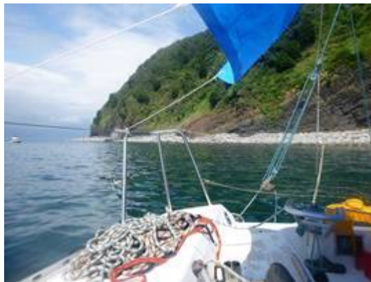
大瀬崎外海でマッタリに時間