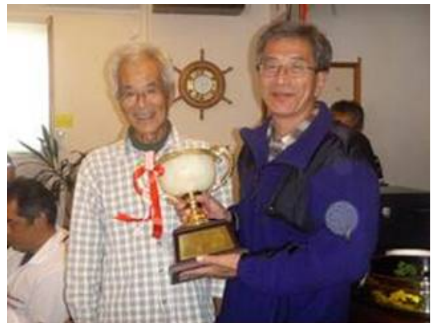
Bクラス優勝「めるあみ」