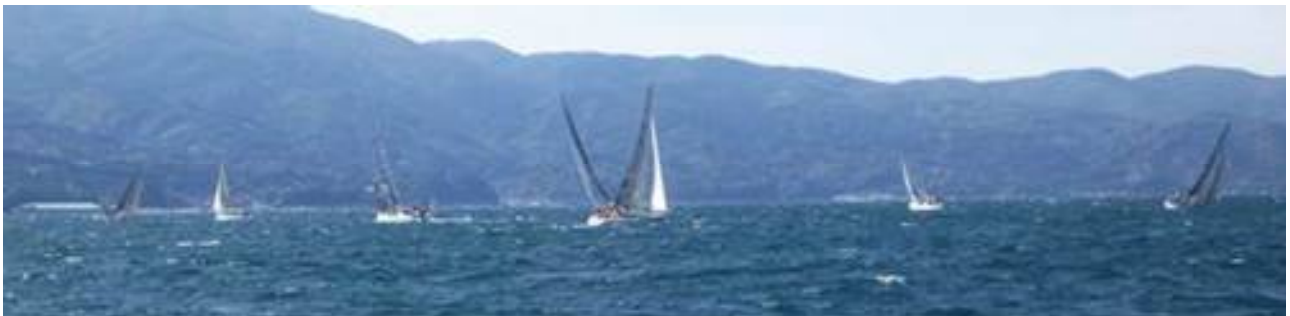
スタート後大久保付近

終了後、クラブハウスで表彰式がありました。Aクラス優勝は、「MIWA」・Bクラス優勝は、「めるあみ」でした。