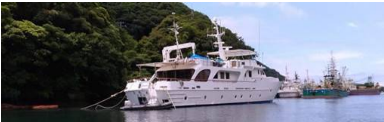
ありし日の光進丸

https://www.youtube.com/watch?v=rMXarBrWlJg&feature=youtu.be