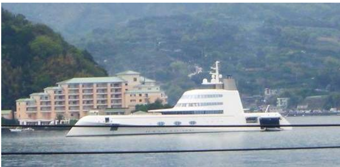
クラブハウス屋上より

全長 120m (390ft) 幅 19m (63ft) 巡航速度 23knot クルー37名 ヘリポート・プール完備 船体価格 320 億円 （澤野さんの情報です）