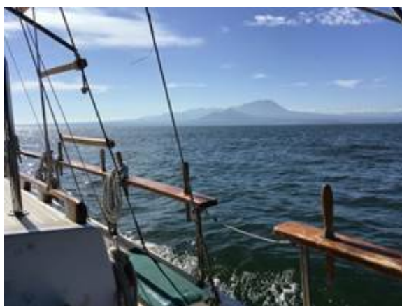
鳥取県境港市を航行中