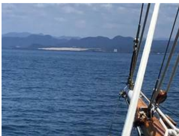
鳥取砂丘沖付近を航行中