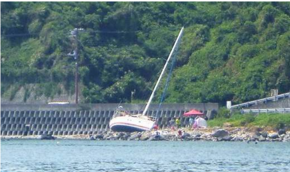
座礁してキールが無い

8月4日（土）にデイクルージングに、大瀬崎まで行く途中この光景に驚きました。 今年は、台風が多く発生する予報です。十分注意しましょう！