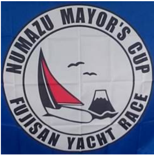
富士山ヨットレース旗