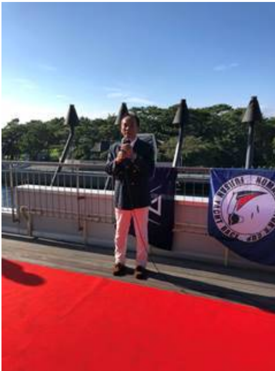
飯島実行委員長挨拶