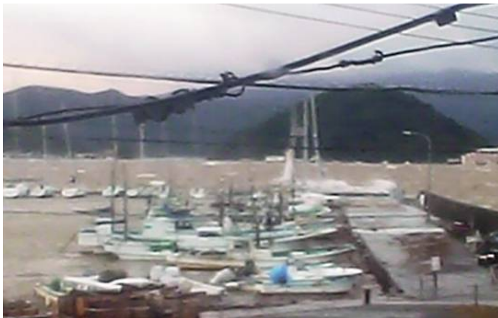
クラブハウスのライブカメラより

会報でも報告がありました。皆さんの艇は、いかがでしたでしょうか？ 寒くなる前に、点検をしましょう！